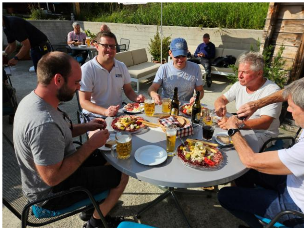
Zvieriplättli für 2 Personen