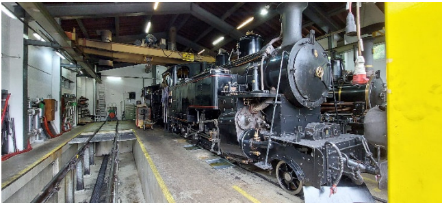
Loki in der Werkstatt