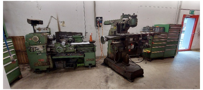
die grosse Drehbank und Fräse