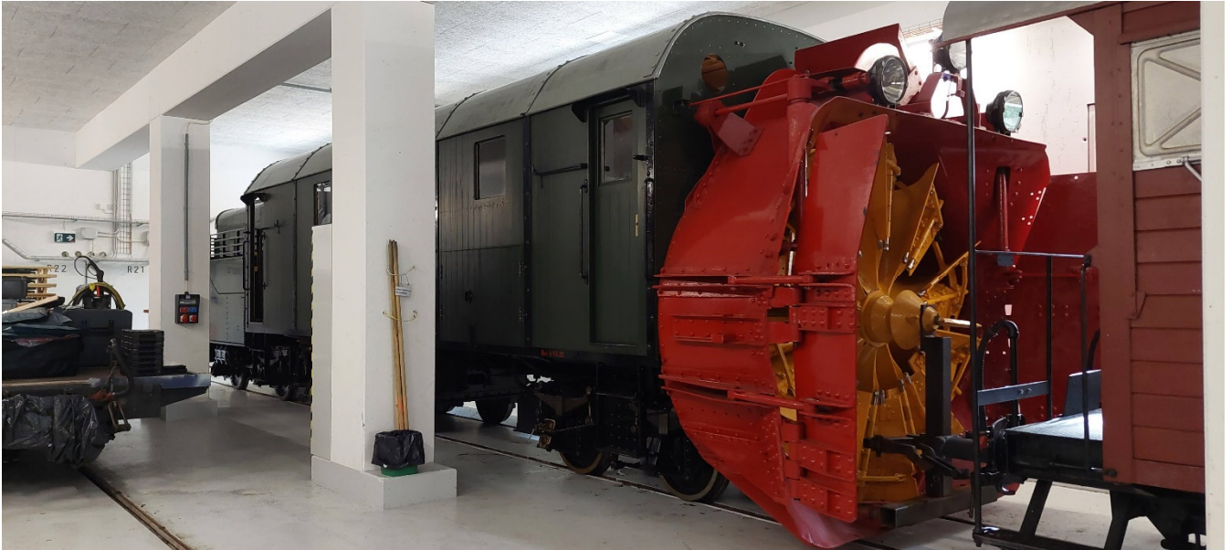
Diese Schneefräse wurde durch eine Familie in 15 jähriger Arbeit wieder zum Leben, sprich Gebrauch, restauriert.