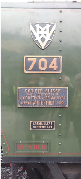
Aus Vietnam zurückgeholt