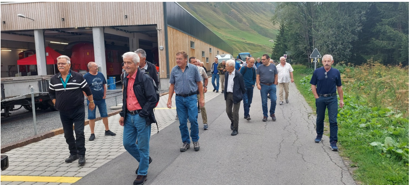
In Realp angekommen